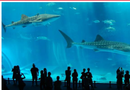
沖繩美麗海水族館