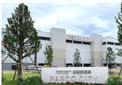
SAN-A 浦添西海岸 Parco City