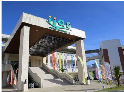
iias 沖繩豐崎購物中心